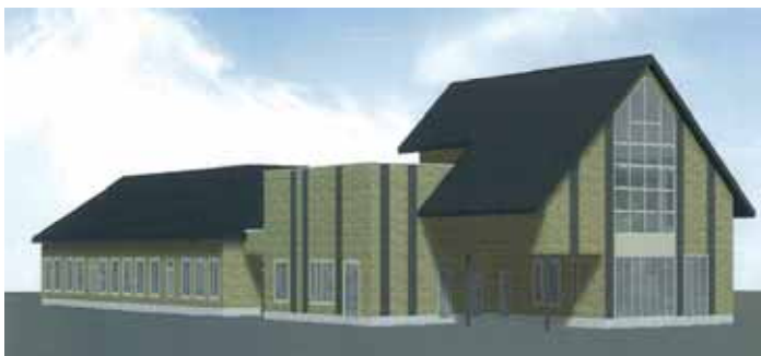
ささづ苑かすが 建物完成イメージ