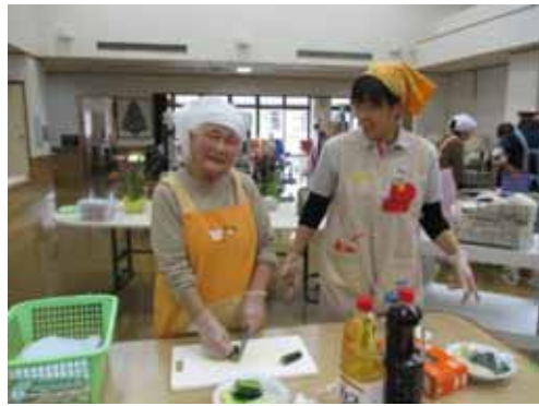
「のっぺい汁づくり」