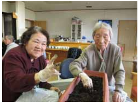
みんなでチューリップを植えています